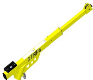
Imm. 1: IN-2237

PARAPETTO AUTOPORTANTE da 876mm PER DPI: IN-8001 (vedere illustrazione 3)