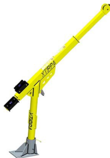
Imm. 3: IN-8005